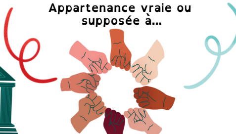
Une prétendue race