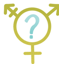
Identité de genre