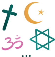
Appartenance vraie ou supposée à une religion