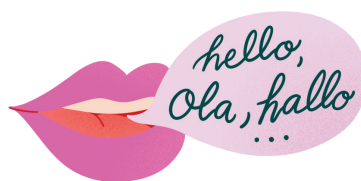
S'exprimer dans une autre langue que le français