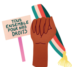
Activités syndicales, mutualistes et mandats